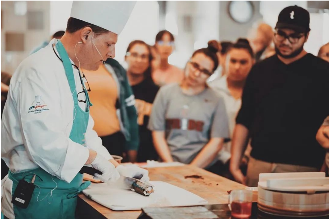
专业的教授及教学设施