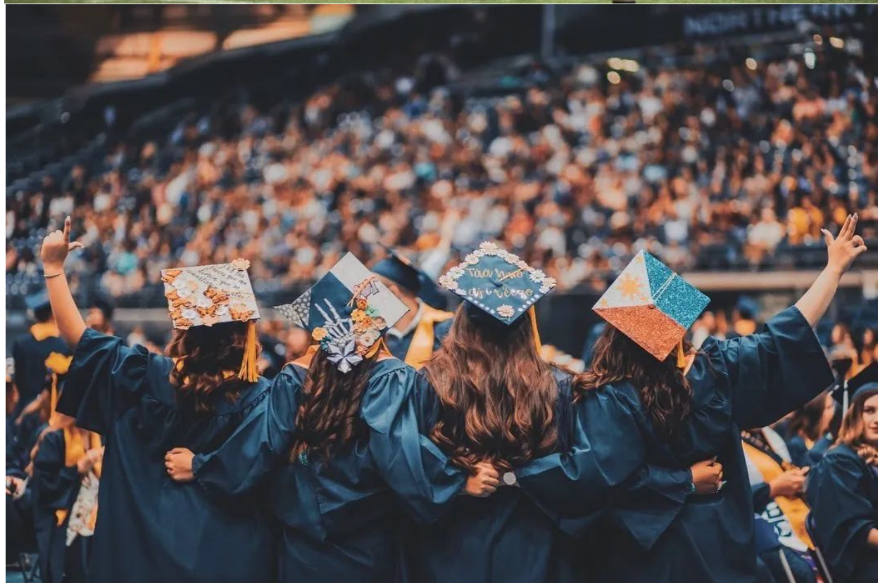
丰富多彩的校园活动