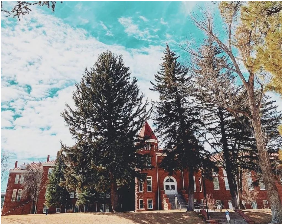
Old Main - NAU 第一座教学楼

北亚利桑那大学建立于 1899 年 ，是一所男女同校的州立公共大学，现有注册学生达 16,000 人。学校占地 738 英亩（相当于 3 平方公里），位于亚利桑那州的 弗拉格斯塔夫市 (Flagstaff) ，该市被享誉全球的著名杂志《国家地理探险》与《国家地理旅行者》同时评为最佳旅游城市和最宜居住城市。弗拉格斯塔夫市位于美国西南部，海拔 2,200 米，人口约 6 万，紧邻闻名世界的大峡谷、拉斯维加斯。