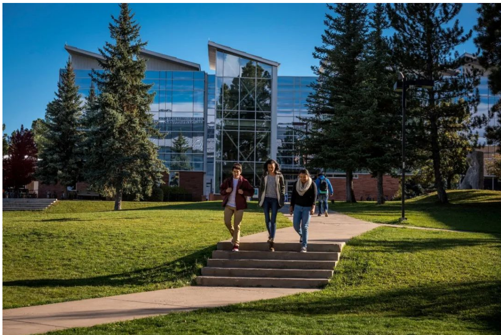
工程信息与应用科学学院

北亚利桑那大学是被中国教育部认可的学位授予单位，其教授本科课程的学院主要有：工程信息与应用科学学院、环境森林与自然科学学院、弗兰克商学院、人文与艺术学院、教育学院、健康与人类服务学院、社会行为学学院。