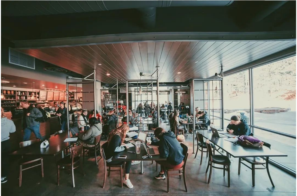
安静整洁的学习环境