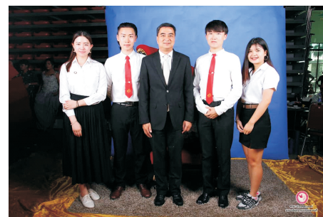
中国留学生与泰国前总理阿披实合影