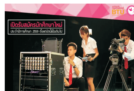
传媒学院学生实践现场