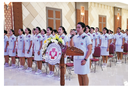
护理学院开学典礼